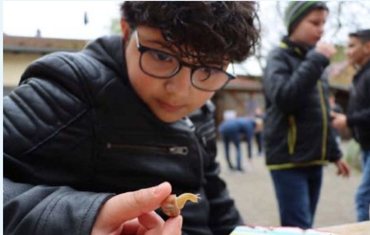
“Wundertag” im Hof unter den Milanen (Buchholz)