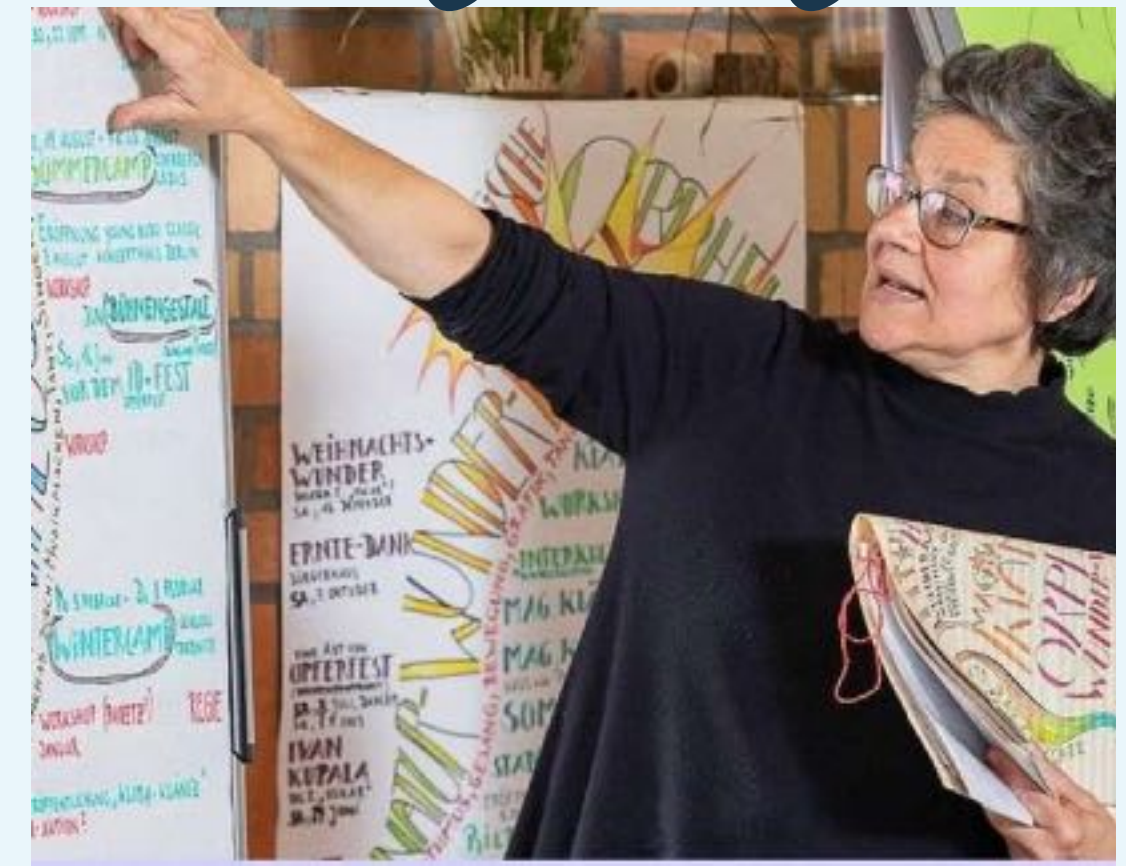
Workshop in der Paretzer Akademie