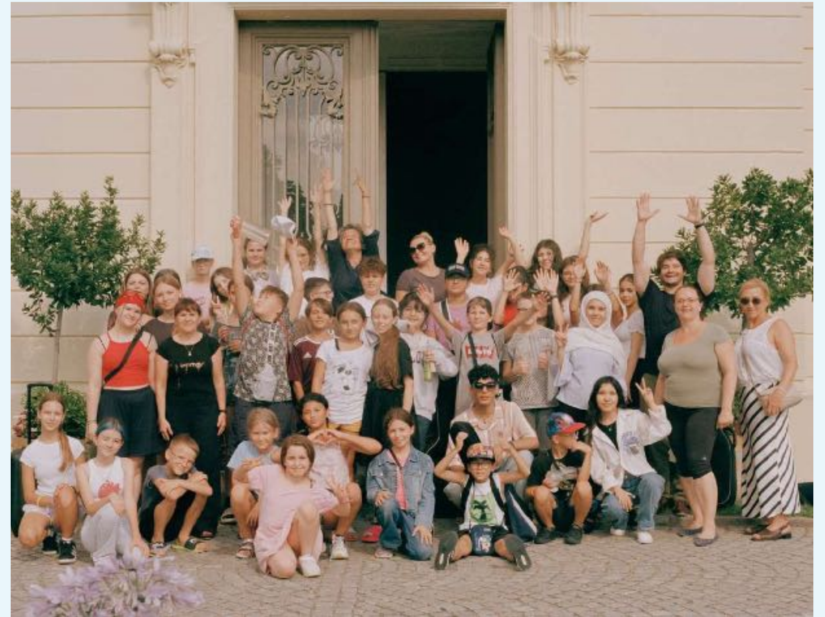
Sommercamp im August