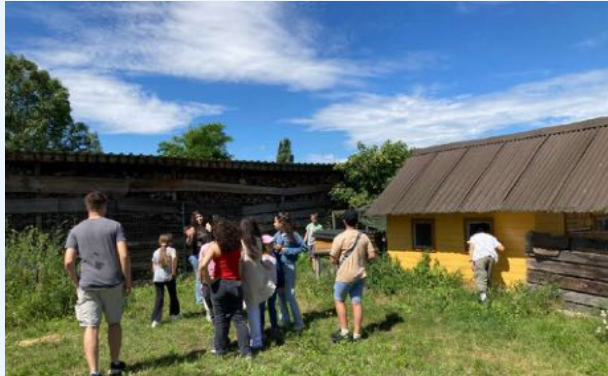
Sommerkonzert mit Jugendblasorchester (Buchholz)