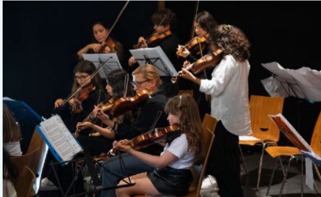
Eid al-Adha-Fest mit der Europa Schule (Ketzin)