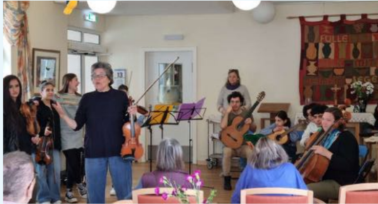
“Wunderklänge-Tag” im Seniorenzentrum (Ketzin)