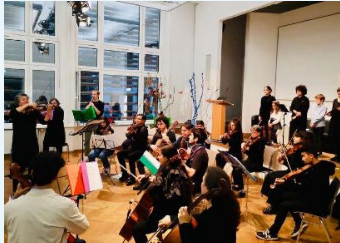
im Potsdam Museum