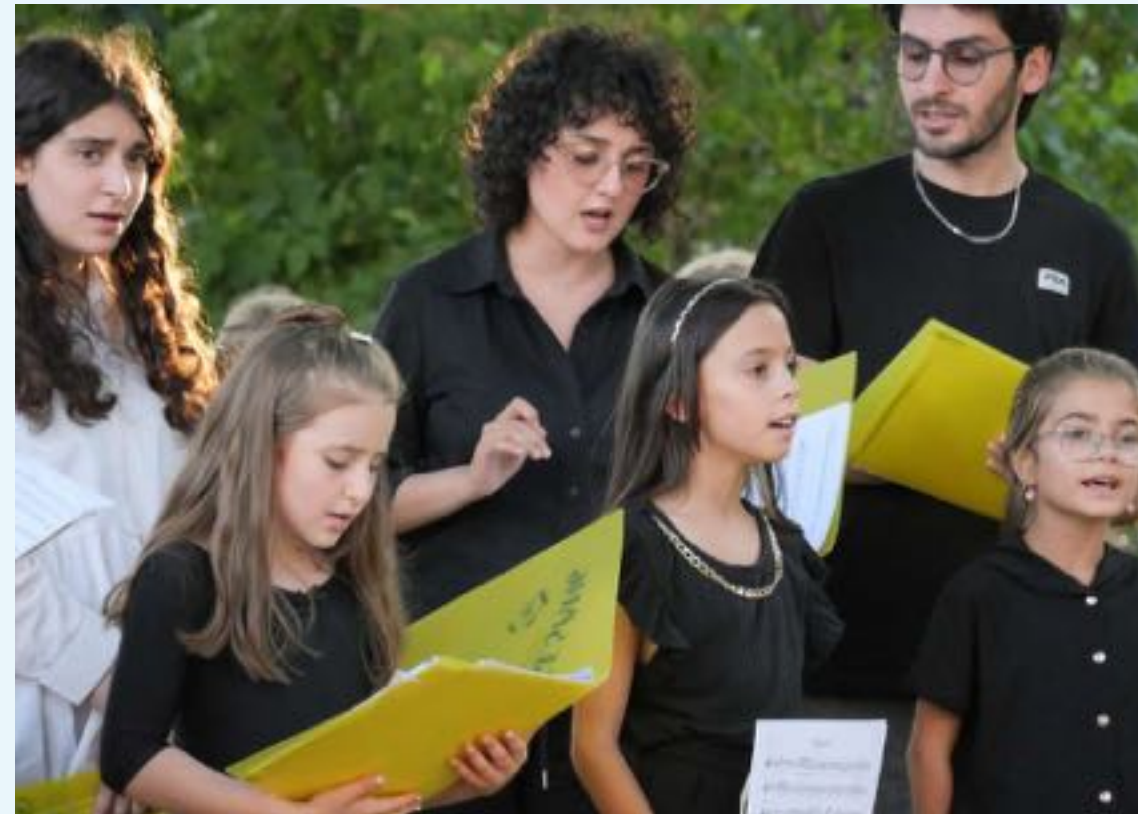
im Park Sanssouci