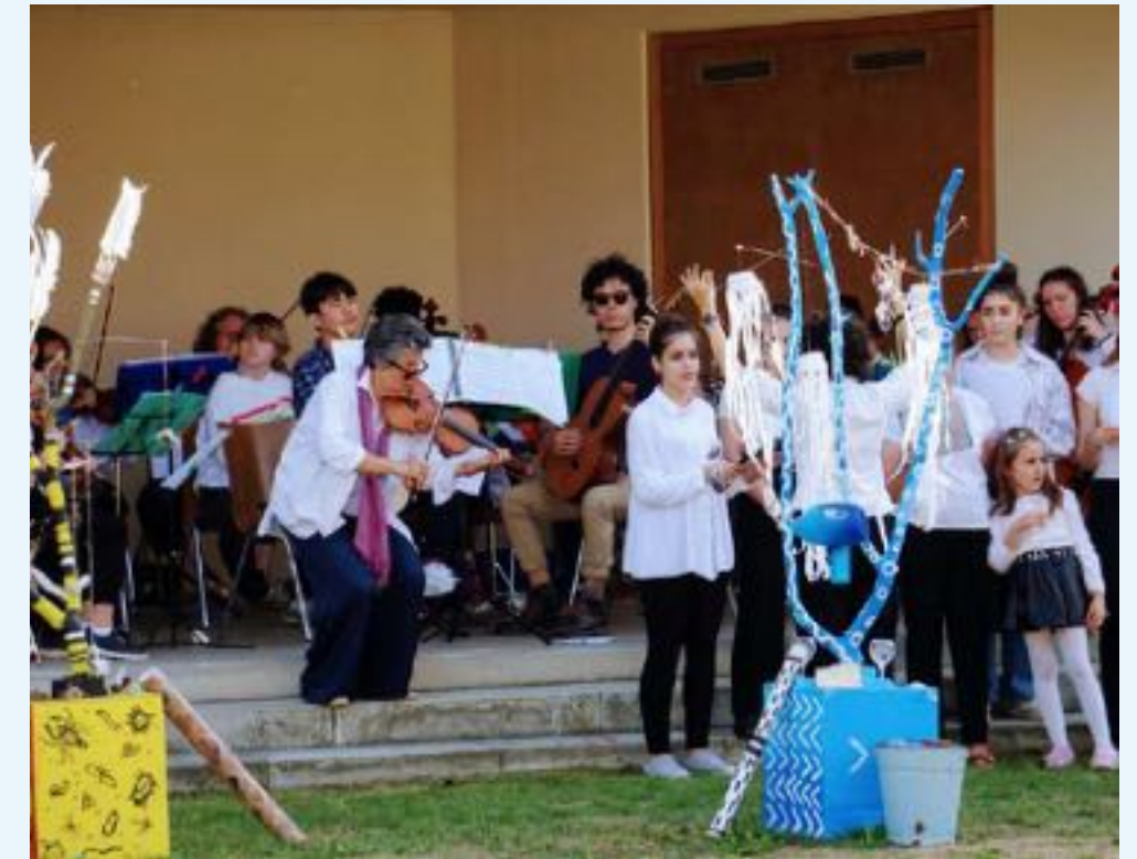
in der Paretzer Akademie