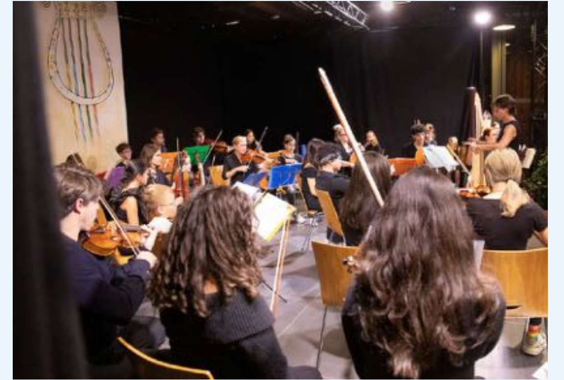
in der Paretzer Scheune