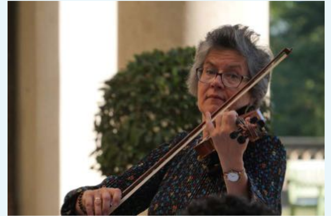
im Park Sanssouci