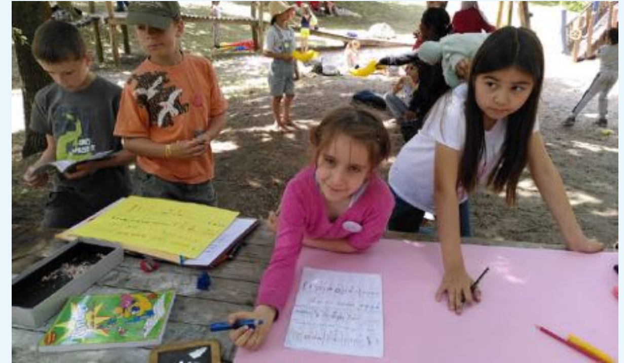
Stadt der Kinder im Bürgerhaus am Schlaatz (Potsdam)