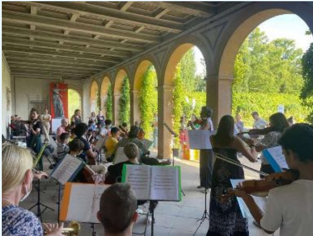
im Park Sanssouci