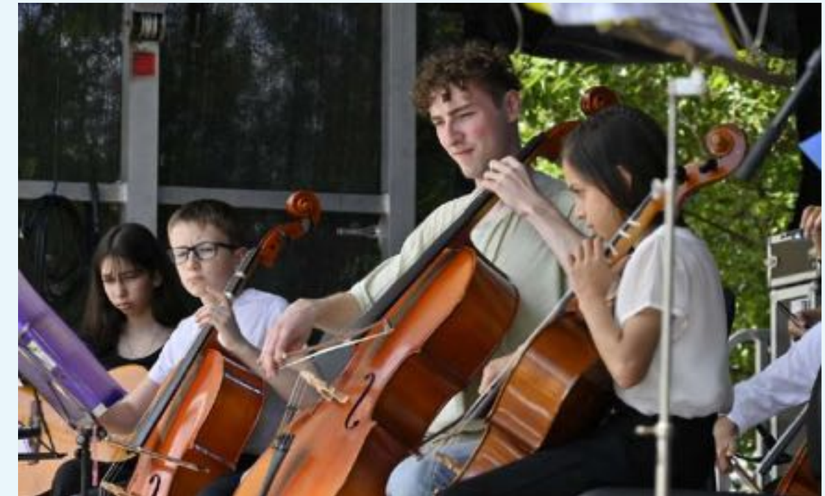
Bürgerfest am Schlaatz (Potsdam)