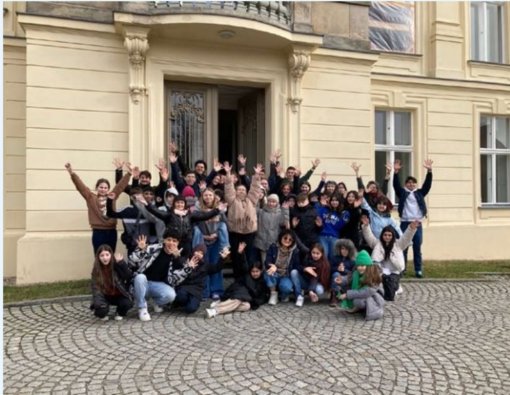
Wintercamp im Februar