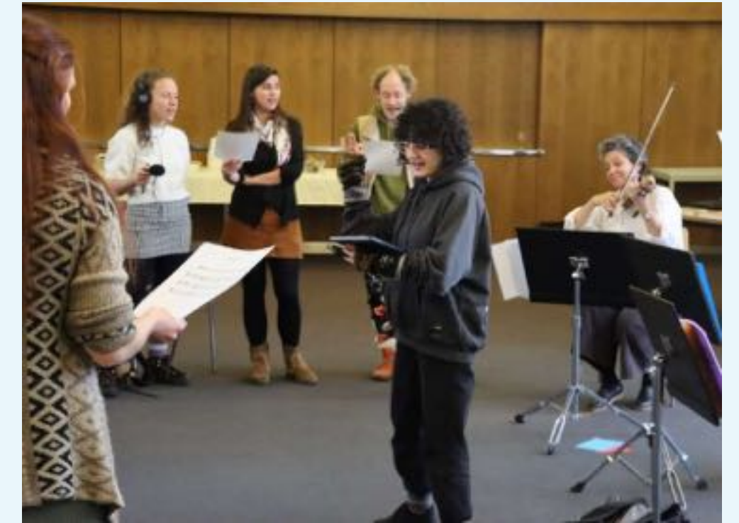
Workshop in Frankfurt (Oder)