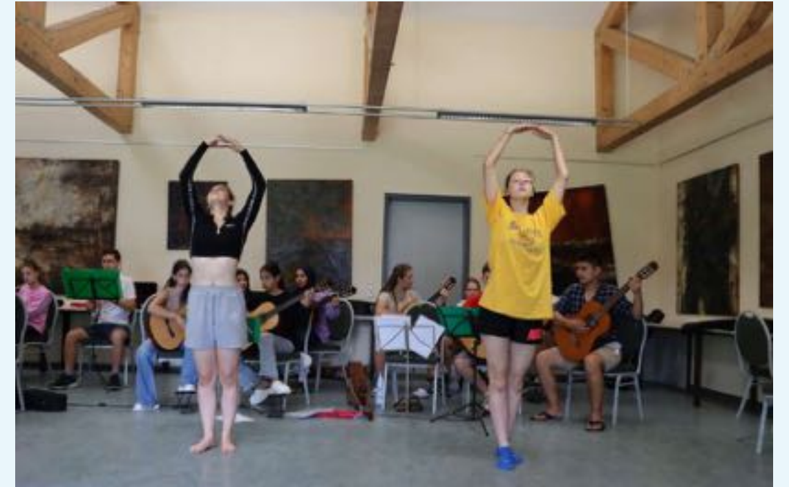
Während des Camps schufen die Teilnehmer*innen Musik, Pop-Up-Dekorationen und eine Choreografie.