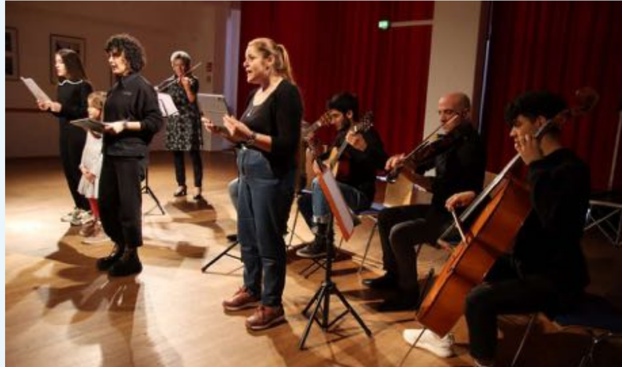
Festveranstaltung zu 30 Jahren Migrantenarbeit (Potsdam)