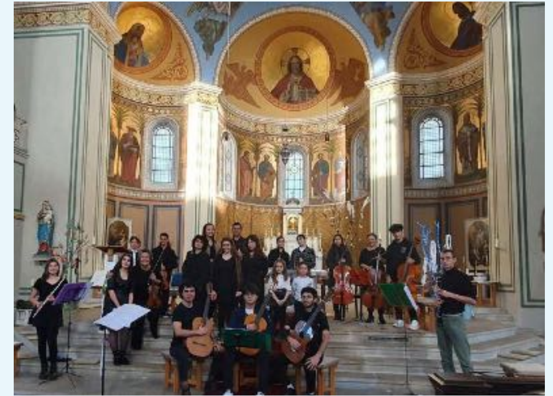
in der St. Peter und Paul Kirche