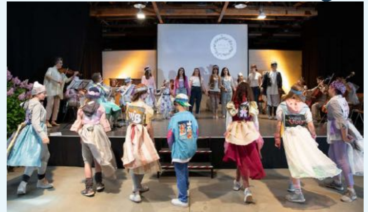
Jubiläum der Paretzer Scheune (Ketzin)