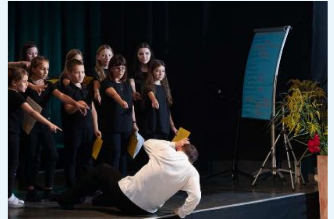
in der Paretzer Scheune