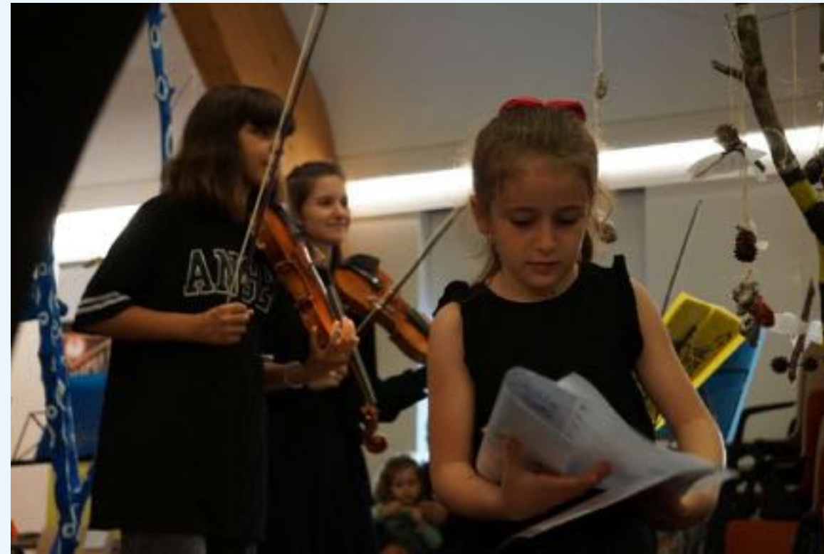
im Museum für Brandenburgische Geschichte